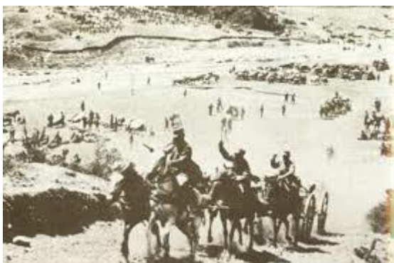
εικόνα από τη μάχη του Κιλκίς