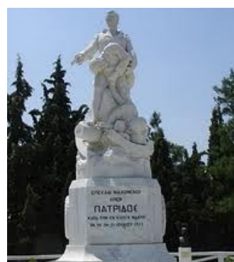
το ηρώο πεσόντων του λόφου

Στη διάρκεια του Μακεδονικού Αγώνα , η πόλη του Κιλκίς υπήρξε άντρο των Βουλγάρων κομιτατζήδων . Στο B' Βαλκανικό Πόλεμο του 1913 , ο Ελληνικός στρατός, ύστερα από την τριήμερη Μάχη Κιλκίς-Λαχανά μεταξύ της 19ης και 21ης Ιουνίου , απελευθέρωσε το Κιλκίς. Με την απελευθέρωση, οι πρώτοι πρόσφυγες που ήρθαν στο Κιλκίς, ήταν από την Περιοχή Στρώμνιτσας. Τότε η πόλη, για λίγο καιρό, μετονομάστηκε σε «Νέα Στρώμνιτσα.» Η μεγάλη ανάπτυξη της πόλης γίνεται μετά τη Μικρασιατική καταστροφή όταν στο Κιλκίς, αρχές του 20ου αιώνα, εγκαταστάθηκαν πολλοί Έλληνες πρόσφυγες από τον Πόντο, τη Μικρά Ασία, τη Στενήμαχο, και την Ανατολική Θράκη.