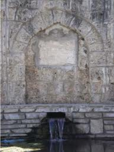
η βρύση Σαλατς από τα χρόνια της τουρκοκρατίας

Κατά τη διάρκεια της Οθωμανικής Αυτοκρατορίας το Κιλκίς αναφέρεται με το όνομα Κιλκίσι και σύμφωνα με την οθωμανική απογραφή του 1530 , το Κιλκίς είχε 195 χριστιανικά νοικοκυριά. Στα τέλη του 18ου αιώνα, το Κιλκίς αποτελούσε τσιφλίκι του Γιουσούφ Μουχλίσ πασά. Οι Κιλκισιώτες συμμετείχαν στην Επανάσταση του 1821 γι' αυτό και δέχθηκαν τα Οθωμανικά αντίποινα μετά το τέλος των εξεγέρσεων στη Μακεδονία . Έτσι το Κιλκίς για άλλη μια φορά καταστρέφεται σχεδόν ολοσχερώς και πολλοί κάτοικοι αναγκάστηκαν να το εγκαταλείψουν. Για άλλη μια φορά, στη θέση όσων το εγκατέλειψαν, εγκαταστάθηκαν Βούλγαροι αγροτοεργάτες, (Α' Βαλκανικός Πόλεμος 1912).